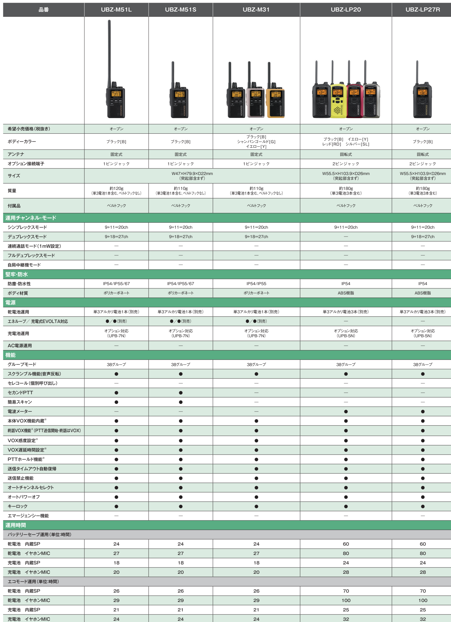
■特定小電力トランシーバー比較表