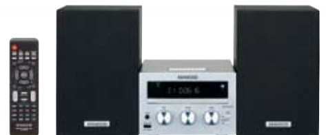
M-616DV-S (シルバー) | オープン価格 | JANコード: 49-75514-050918

■ M-616DV主な定格 【アンプ部】●実用最大出力: 20W+20W (JEITA 60) ●入力感度 (感度 / インピーダンス): AUX IN 125mV / 47kΩ ●出力端子: AUDIO OUT 0.5V (rms)、DIGITAL OUT (同軸) 【FMチューナー部】●受信周波数範囲: 76.0MHz ~ 90.0MHz ●アンテナインピーダンス: 75Ω不平衡 【DVDプレーヤー部】●読み取り方式: 非接触光学式読み取り (半導体レーザー) ●信号方式: NTSC ●映像出力: 1Vp-p (75Ω) ●コンポーネント映像出力: Y信号 1Vp-p (75Ω)、Cb / Cr信号 0.7Vp-p (75Ω) 【USB部】●対応USB機器: USBマスタートレージクラスデバイス ●インターフェイス: USB2.0 (Full Speed)、USB1.1互換 ●対応ファイルシステム: FAT16 / 32 ●供給電圧: 500mA 【iPod / iPhone部】●供給電流: 1A ●iPod / iPhone接続方式: アナログ 【電源部: その他】●電源電圧: 電源周波数: AC 100V、50Hz / 60Hz ●定格消費電力: 35W ●待機時消費電力: 0.5W以下 ●最大外形寸法 (約): W160×H108×D270mm ●質量 (約): 1.5kg 【スピーカー部】●方式: ハスレ方式 ●ユニット: 89mmコーン型 ●インピーダンス: 6Ω ●最大入力: 20W ●最大外形寸法 (約): W136×H210×D180mm ●質量 (約): 1.3kg (1本)