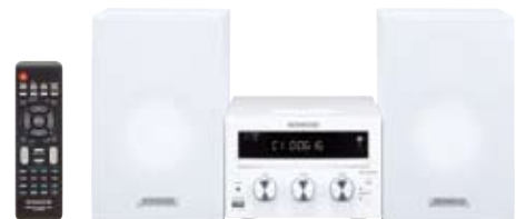
M-616DV-W (ホワイト) | オープン価格 | JANコード: 49-75514-050925