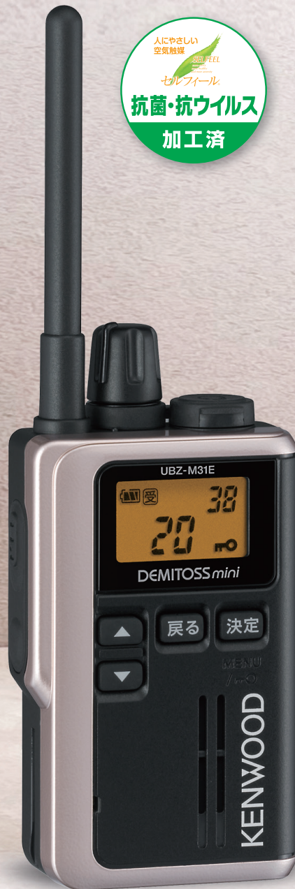
《実物大》 UBZ-M31E G