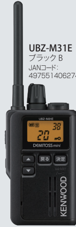
UBZ-M31E ブラック B JANコード: 4975514062744