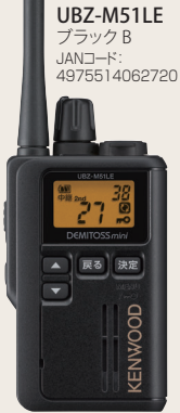
UBZ-M51LE ブラック B JANコード: 4975514062720