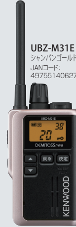
UBZ-M31E シャンパンゴールド G JANコード: 4975514062768