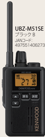
UBZ-M51SE ブラック B JANコード: 4975514062737