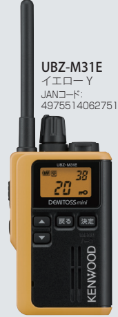
UBZ-M31E イエロー Y JANコード: 4975514062751